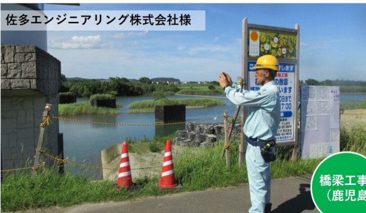
佐多エンジニアリング株式会社様