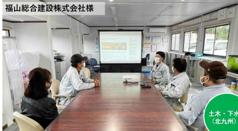
福山総合建設株式会社様

ISOの要求事項「組織の知識」の評価に貢献。 審査員からも高い評価を受けました！